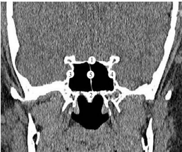
Рис.1. КТ. Фронтальний зріз голови людини зрілого віку

1. верхня стінка клиноподібної пазухи; 2. нижня стінка клиноподібної пазухи; 3 - 4. бічні стінки клиноподібної пазухи; 5. перегородка клиноподібної пазухи