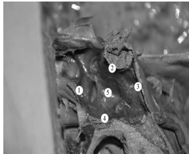
Рис. 2. Сагітальний зріз голови людини зрілого віку

На 16 досліджених препаратах (40%) між передньою і нижньою стінками пазухи утворювався майже прямий кут. На 2 препаратах (5%) перехід передньої стінки клиноподібної пазухи в нижню мав форму неправильного овалу і визначити межу переходу передньої стінки в нижню майже неможливо. На 8 препаратах (20%) передня стінка була нахилена допереду, а на 3