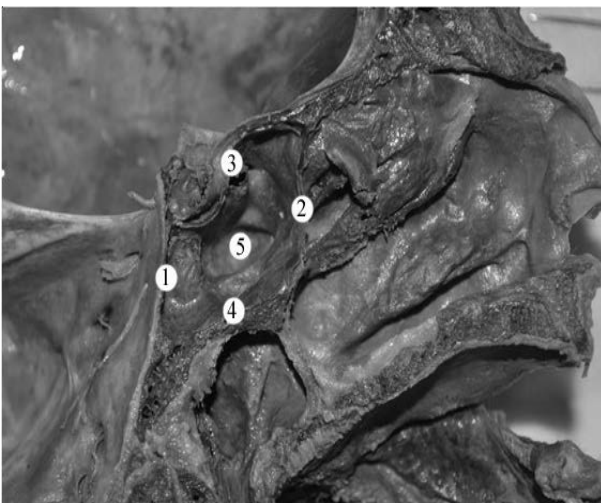
Рис. 3. Сагітальний зріз голови людини зрілого віку

На одному препараті (2,5%) товщина стінки не перевищувала 1,8 мм. На бічних краях нижньої стінки виявляються поздовжньорозташовані канали крилоподібних нервів, всередині яких