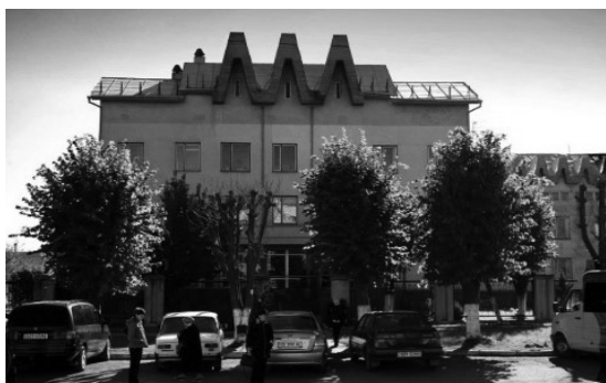
Фото 2. КНП «Міська поліклініка №3»

Кафедра сімейної медицини з самого початку була створена на базі комунального некомерційного підприємства (КНП) м. Чернівці «Міська поліклініка № 3», де в червні 2001 року відкрито відділення сімейної медицини (фото 2). Цей заклад і на сьогодні залишається основною базою кафедри. Додатково клінічними базами кафедри (фото 3-5) є також КНП «Міська поліклініка № 1», ОКНП «Чернівецький обласний перинатальний центр». Для навчального процесу використовуються низка стаціонарних клінічних закладів міста – обласні КНП «Чернівецька обласна клінічна лікарня», «Лікарня швидкої медичної допомоги», «Обласний клінічний кардіологічний диспансер», міська дитяча клінічна лікарня, обласна психіатрична лікарня. Окрім того, консультативно-лікувальна робота викладачами кафедри здійснюється також у позабазових установах міста та області.