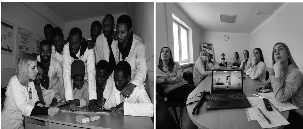
Фото 11. Відпрацювання навичок розшифровки ЕКГ з іноземними студентами, а також розгляд клінічного випадку разом із лікарями-інтернами