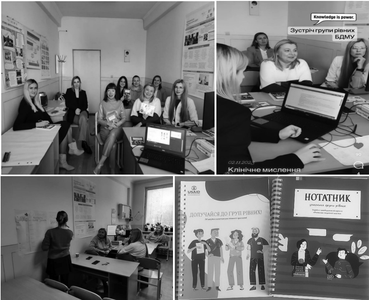
Фото 10. Засідання група рівних на кафедрі сімейної медицини на тему «Позиційне доброякісне запаморочення» (практичне відпрацювання викладачами кафедри клінічного кейсу та проби Дикса-Холпайка), лютий 2024 року