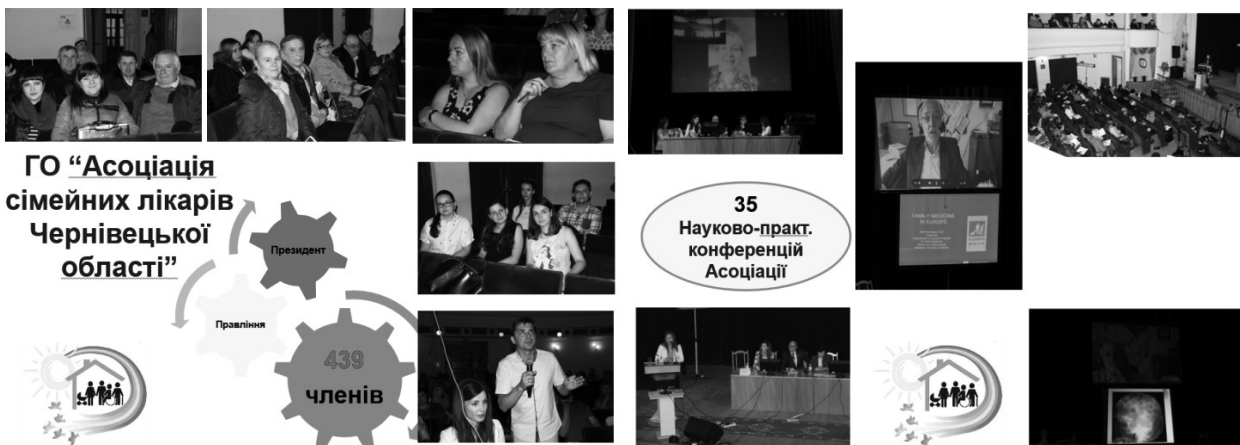
Фото 15. Засідання ГО «Асоціація сімейних лікарів Чернівецької області»