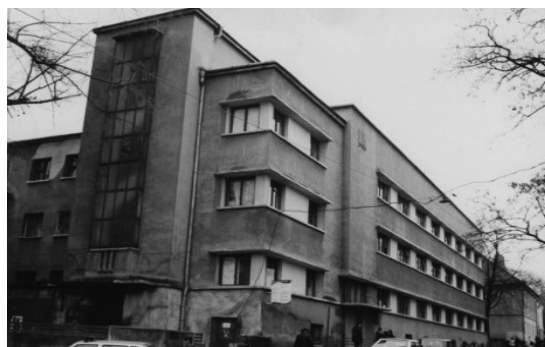
Фото 3. КНП «Міська поліклініка №1

Клінічна та експериментальна патологія. 2024. Т.23, № 2 (88)