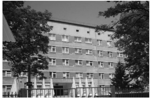
Фото 5. ОКНП «Чернівецький обласний перинатальний центр»

Сучасні методи навчання дають можливість здобувачам освіти отримувати знання дистанційно та безперервно. Одним із таких є сервер дистанційного навчання БДМУ електронних навчальних курсів