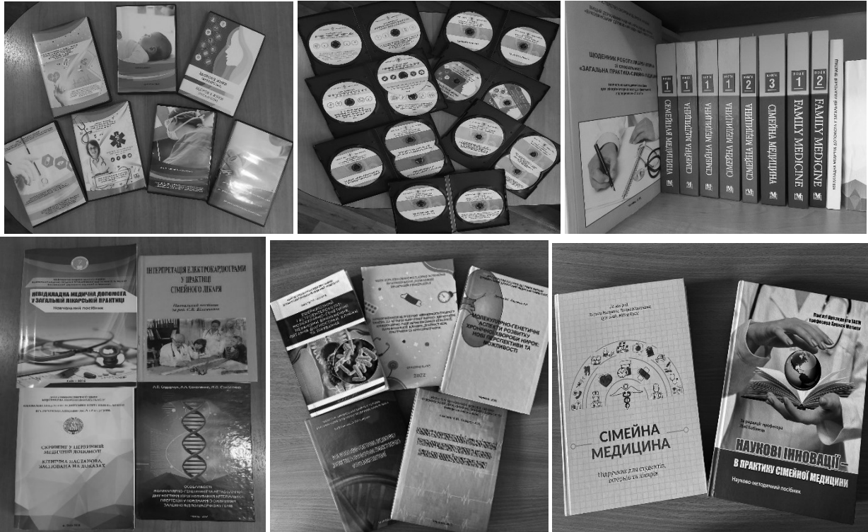
Фото 9. Окремі навчально-методичні матеріали видані кафедрою сімейної медицини БДМУ чи за співучасті її співробітників за останні 5 років