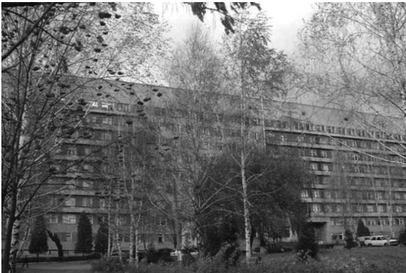
Фото 4. ОКНП «Лікарня швидкої медичної допомоги»

Основними напрямками у забезпеченні підготовки лікарів за спеціальністю «Загальна практика – сімейна медицина» (ЗПСМ) на післядипломному рівні є інтернатура, яка триває два роки, а також проводиться первинна спеціалізація за фахом «Загальна практика – сімейна медицина» (ЗПСМ) лікарів інших спеціальностей. Окрім того, викладаються дисципліни «Медсестринство в сімейній медицині» для студентів 3-4 курсів та «Сімейна медицина» для студентів 2-го курсу медичного факультету № 4 з відділенням молодших медичних і фармацевтичних фахівців зі спеціальності «Медсестринство» (освітньо-кваліфікаційний рівень – молодший спеціаліст, бакалавр, магістр).